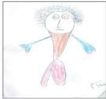
( رسوم الاطفال )

التحليل: يظهر في رسم النموذج الاول لرسم الفطرين استخدام التلميذ الوان الخشب اللون الجوزي بطريقة التظليل الظل والضوء برسم الزي العربي مع الدلة العربية والجلسة العربية بتفاصيلها الراقية الجميلة لثراث العراق، نجد التلميذ الموهوب بالفطرة طريقة رسمه للخطوط والاشكال ونقل الافكار بشكل ملفت للنظر يظهر المهارة والدقة في ايصال الفكرة اذ يحاول اظهار التفاصيل الدقيقة والتصوير والنقل الحي للواقع مطابقة الواقع، بشكل جميل عفوي . بينما نلاحظ رسم التلميذ (الغير فطري) (رسوم الاطفال) يتميز بالتبسيط والتسطيح اختار التلميذ موضوع صياد السمك ورسم القارب بشكل بسيط يبدو محلق في الرسم ورسم الشمس و الغيوم و الصياد تم رسمه بشكل يختلف بالنسب عن الجسم الطبيعي بتضخيم اجزاء وتصغير اجزاء اخرى حسب وجهه نظر التلميذ وحسب فهمه للموضوع وطريقة نقله وتصويره للواقع.