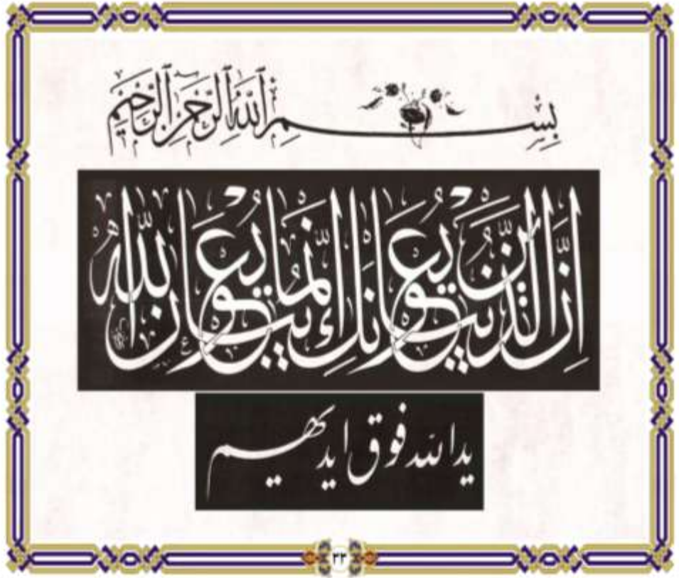
صورة (١) نموذج خط الثلث