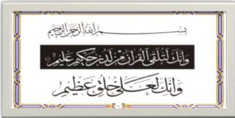
صورة (٢) نموذج خط الثلث