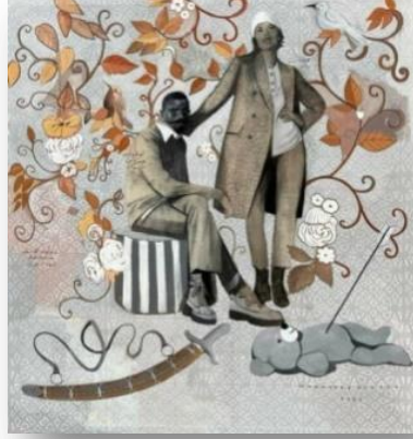
رقم العينة (١)