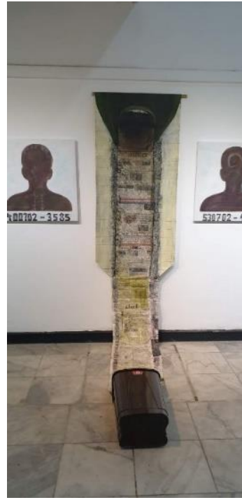
الشكل (١٣) كريم السعدون -أكياس ممتلئة