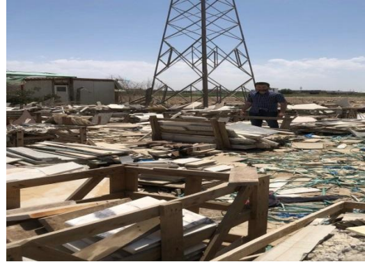
شكل رقم (9)