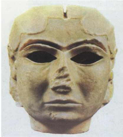
شكل رقم (2)

السومريين العظيم، بجمالية التمثال بصدد تنوع الخامات، وألوانها لارتباط ذلك بحبهم للحياة، والعقائد التي كانوا يدينون بها (1).