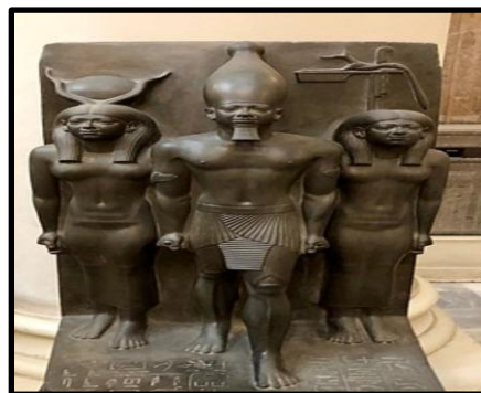
شكل رقم (3)

يعد الإغريق أن التماثيل كانت بشكل، أو بأخر كأنها كائنات حية، وكان الجهد منصبا على جعلها فعلا كذلك، وبعض التماثيل الشعائرية وكانت في بعض الأعياد تغسل، ثم تمسح بالزيت، وكان هذا المسح الاحتفالي بمثابة وسيلة سحرية لإحيائها، ولعل أعجاب الإغريق بالحجر وتعلقهم به بوصفه مادة العمل