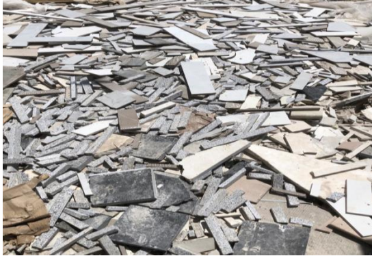
شكل رقم (10)

قام الباحث بجمع البيانات الخاصة بالاعتماد على معامل الاحجار والمرمر الطبيعي التي من خلالها حدد عيناته بعد اجراء المسح والتعرف على اشكال وانواع هذه الالواح والمنتشرة ضمن الرقعة الجغرافية للحدود المكانية لمحافظة الديوانية وبابل .