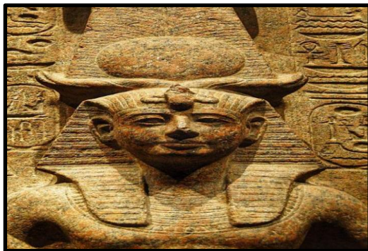
شكل رقم (4)

ونظرية النسب في الفن المصري القديم غايتها فنية، وليست رمزية تتعلق بالواقع الحي، إذ واجهتها أدراك حقيقة، فكان من المفترض في الجسم الإنساني المصور في الفن المصري القديم أن يكون مفعماً بالحياة الحقيقية، وعندما تدل صورته على إمكانية أن يصبح حياً، أو ممثلاً للحقيقة، لذا شرع الفنان إلى إعادة صياغة الشكل، اعتقاداً منه بأن التمثال الذي موضعه، حجر الدفن لم يكن يأتي بحياة جديدة من تلقاء نفسه، وإنما هو يمثل مادة بديلة لحياة أخرى، وهي حياة الروح، وهكذا ينظر للتمثال على أنه مجرد جسد ينتظر أن تعود الحياة فيه مرة أخرى فهو يجمع بين الحقيقتين الفنية والسحرية (3).