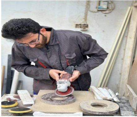
شكل رقم (12)

التقاطها من معامل المرمر الطبيعي ، وتنظيفها من العوالق والأتربة بغسلها، وتجفيفها بهدف الشروع بعملية النحت.