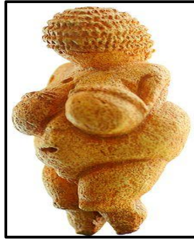
شكل رقم (1)

ومن المعالجات التقنية عند المصريين القدماء التي تعتمد على الخاصية الهندسية في إدراك الأشكال المراد نحتها من خلال خطة هندسية ترسم على سطح الكتلة الحجرية، إذ كان الفنان يرسم أربع تصميمات منفصلة على السطح الرأسي للكتلة الحجرية، ويقوم بتزويد هذه التصميمات بتصميم خامس، ثم يقوم بإخراج الشكل النهائي بإزاحة الحجارة الزائدة عن الشكل (2).