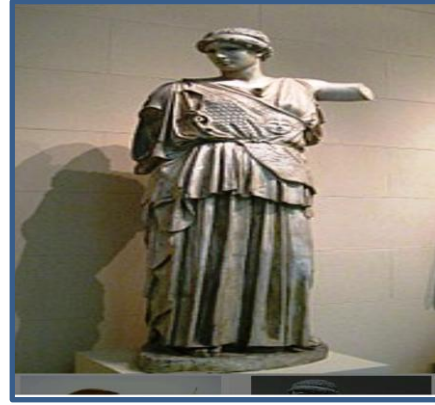
شكل رقم (6)

وبدا مايكل أنجلو بتقليد بعض الأعمال الكلاسيكية بإتقان شديد، ودرس أوضاع الجسد الإنساني وتحركاته ضمن البيئة المتنوعة، فجميع أعماله الإبداعية لم تخل من الشكل الإنساني، فقد كان يختار أكثرها صعوبة ودقة ويحاول تنفيذه، واغلب موضوعاته التي كان يعمل بها كانت تستلزم جهدا عقليا كبيرا وبالخصوص تماثيله الحجرية (3) . ولقد عبر النحات مايكل أنجلو عن شخصيه النبي موسى من خلال مهارته لتحرير هذه الشخصية من الحجر التي يبدو فيها الشكل باندفاعه القوي نحو الأمام مع انحصاره، وانحباس حركته في الوقت نفسه كما في الشكل (8) ولكن هذا التمثال ينقل ألينا في صورة قيمة وإحساس فريدين إلى أعلى درجة، معنى التفاوت الأبدي (التنافر الخالد) بين الطموح، أو النزوع من جهة والكسب أو التحقيق من جهة أخرى (4) .