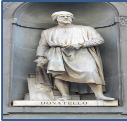
شكل رقم (7)

تشريح الرجال دون النساء وفي تصويره للنساء يستبدل بدقة التشريح الجسمي بتمثيل دقائق الثياب شكل (6) بشكل أحسن (1) . إن ما جاء به النحاتون الإيطاليون الأوائل جيبيرتي وديانتلو من معالجات تقنيه جديدة مستندة في ثنائياها على النحت الإغريقي فتح الباب على مصراعيه أمام عباقرة جدد قد شكّلوا نهضة في مجال النحت، ويعد مايكل أنجلو أبرز نحات خلال هذا العصر، وما يميز فنه هو الجمع بين مفهوم الحساسية الشديدة للمؤثرات الدينية، ومظاهر الطريقة التي تتجلى في أحلال عامل الإحساس في مكانه الانسجام كما في الشكل (7) (2) .