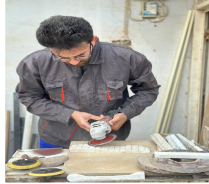
شكل رقم (11)

حيث اعتمد الباحث على الأدوات الكهربائية وبعض الأدوات اليدوية كالمبارد لسفل السطوح والحواف التي لا يمكن للألة ان تصل لها للتنفيذ تجربته الحالية واقتصر استعمال الآلات الكهربائية على عمليات التقطيع والحفر إضافة الى مواد اللواصق التي ربطت اجزاء العمل الفني فيما بينها كمادة المرمر الصناعي او مادة التيتانيوم , وقد حرص الباحث على استعمال الآلات دقيقة تلافيا لتلف الألواح الرقيقة على اعتبارها جزء من عينة البحث وما دامت هذه الألواح تستجيب لفعل الأدوات الكهربائية واليدوية كانت الغلبة لها في عملية التشكيل فضلا عن الخبرة الشخصية للباحث في الحرص على تحرير منحوتاته باستخدام هذه الأدوات التي يراها مهمة جدا في نقل إحساساته بشكل صادق الى سطح الخامة التي يتعامل معها وهذا الأمر اعتمد على جودة الألواح وطبيعته التي تتيح للنحات التعامل معه بالطريقة التي تكفل له استخلاص الشكل الفني المؤثر الذي يحمل ابعادا جمالية تحاكي الذائقة المعاصرة .