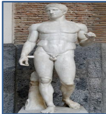
شكل رقم (5)

حيث استطاع النحات بولكليت أن يحقق قواعد النحت وأصوله التي تم الارتكاز عليها، فجاء تمثاله (القانون) ثمرة الخبرات التي جمعت في شخص هذا النحات الذي كان أرسطو معجباً بفته، إذ نجد في التمثال تقنية مبتكرة أصبحت بعد ذلك إنموذجاً يحتذى به من قبل النحاتين وعلى الرغم من كون المادة التي تم تنفيذ العمل منها هي مادة الرخام إلا أنه استطاع أن يعل ثقل الجسم في تمثاله يستند على ساق واحدة في حين أرخى بساقه الأخرى إلى الإمام مما أعطى التمثال هيئة أكثر حيوية، وجمالاً، ومعادلات تنظيم النسب بين هذه الأجزاء إلى بعضها بعضاً مما أعطاه تماسكاً يوحى بالشعور بالقوة والجمال (3).