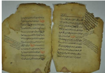
الورقة الأولى من مخطوطة الورقة الأخيرة من مخطوطة (ثلاث أوراق في الديانة اليزيدية) (ثلاث أوراق في الديانة اليزيدية)