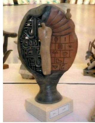
شكل (1) شكل (2)

وهنا ظهرت براعة الخزاف في توصله الى درجات متقدمة تعبيرياً ، وجمالياً، اي عمل الخزاف حيدر رؤوف له خطاب فيما بين العناصر بإيصال فكرة الى الجمهور حسب ثقافته وايضا هناك خطاب بين المتلقي او نقاد العمل الخزف العراقي وهذا ما يعطي موضوع تواصل من خلال التشكيل الهندسي في الشكل (3، 4) وأخيراً فأن النمط للخطاب الفني هو المجموع الكلي لجميع هذه العناصر لإنتاج بنية لها أهدافها وطرقها الفنية في الإبتكار (34) .