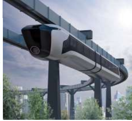
شكل (3) يوضح تطبيقات الفلسفة البروجماتية في ابتكار المنتجات الصناعية

اختيارات الفرد على نحو ما هو مفضل وغير مفضل , وهي في جوهرها نتاج اجتماعي , يتشربها الفرد من خلال انفعاله وتفاعله مع المواقف والخبرات المتنوعة 19 ان نظرة الى الواقع تبين لنا ان كل القيم التي استخدمناها الى حد الان , والتي أردنا من خلالها الحكم على الاشياء وتثمينها ليست في الحقيقة الا أحكاما مستمدة من مواقفنا المنفعية تجاه تلك الاشياء , نسعى من خلالها الى تجسيد بعض أشكال السيطرة الانسانية على العالم , ومن هنا يمكننا القول بأن سداجة الانسان هي التي تكون المنطلق لهذه المعاني والقيم التي دأبنا على منحها للأشياء ويؤكد الفيلسوف (نيتشه) ان الانسان يحتاج الى انتاج أحكام قيمة يبرر بواسطتها لنفسه وخاصة لمحيطه جملة أفعاله ومواقفه , ولكن العمل الفلسفي الأهم يتمثل في تحديد أصل هذه القيم الأخلاقية التي يتداولها الناس في ما بينهم . وان كل الأفعال الانسانية ترتبط بأحكام قيمة , وهذه الأحكام إما ان تكون شخصية , وإما ان تكون أحكام مكتسبة من خارج الذات , مع التأكيد بأن الاحكام المكتسبة من الخارج هي الأكثر شيوعا . ومن المفارقة ان الاحكام المكتسبة تتحول في نهاية الأمر عن طريق العادة الى طبيعة ثانية فينا . ان حكم القيمة الشخصي لدى (نيتشه) بمثابة تثمين للأشياء انطلاقا من درجة اللذة والألم التي يثيرها فينا , وهذا الحكم الشخصي يعتبر نادر الوجود