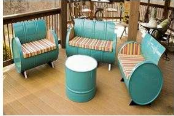
شكل (5) يوضح تطبيقات فلسفة القيم الاخلاقية البيئية في المنتجات الصناعية