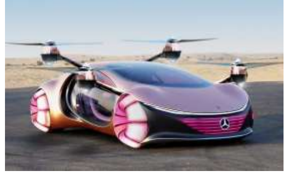
شكل ( 4 ) يوضح تطبيقات قيم خطاب الفلسفة الجمالية في المنتجات الصناعية

ويمكن تتبع هذا الارث القيمي الاخلاقي بشكل أعمق بالعودة الأدب السومري، أو شريعة حمورابي، أو المدارس الأخلاقية في مصر القديمة والكتب الفيديوية المقدسة في الهند، والفلاسفة الصينيين الكلاسيكيين مثل كونفوشيوس وموزي وفلاسفة العصر الاسلامي (الفارابي وابن خلدون) وقد وُجدت هذه الأنظمة القيمية جميعها قبل الإغريق القدماء، مثل سقراط وأفلاطون وأرسطو إلا أن الفلسفة الغربية تعتبر افلاطون