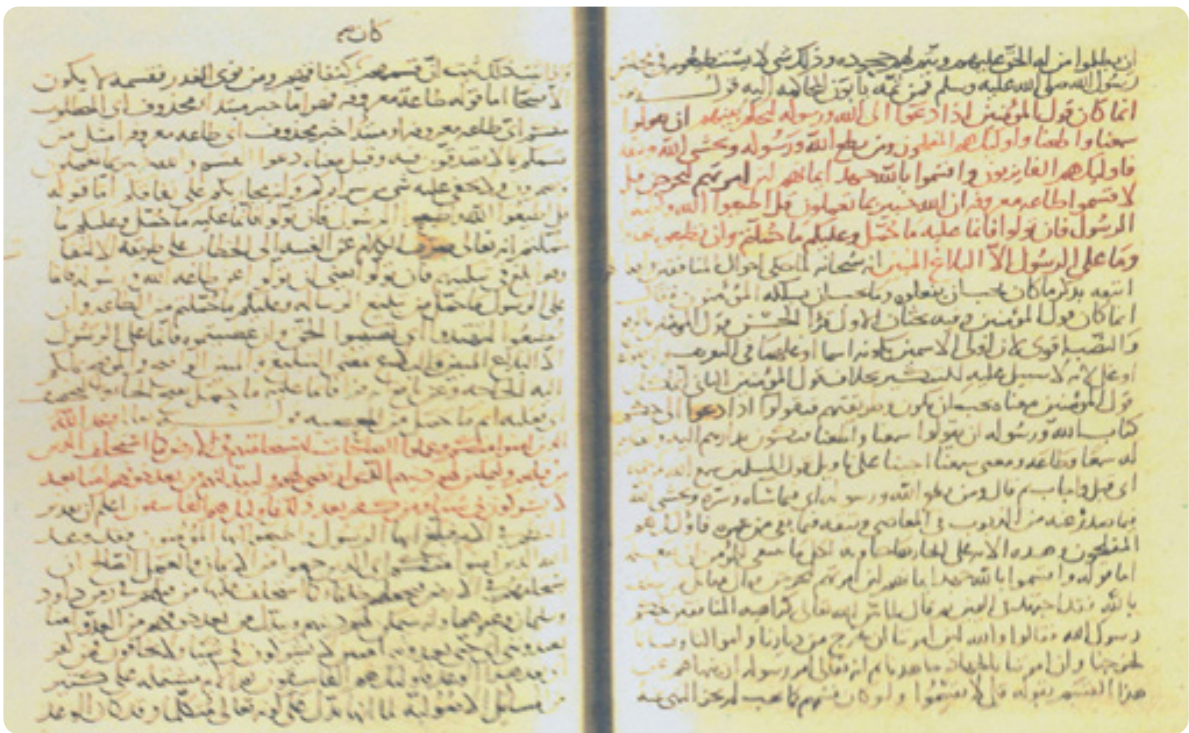
الصورة الثانية من النسخة (م) للجزء الخاص بهذا البحث.