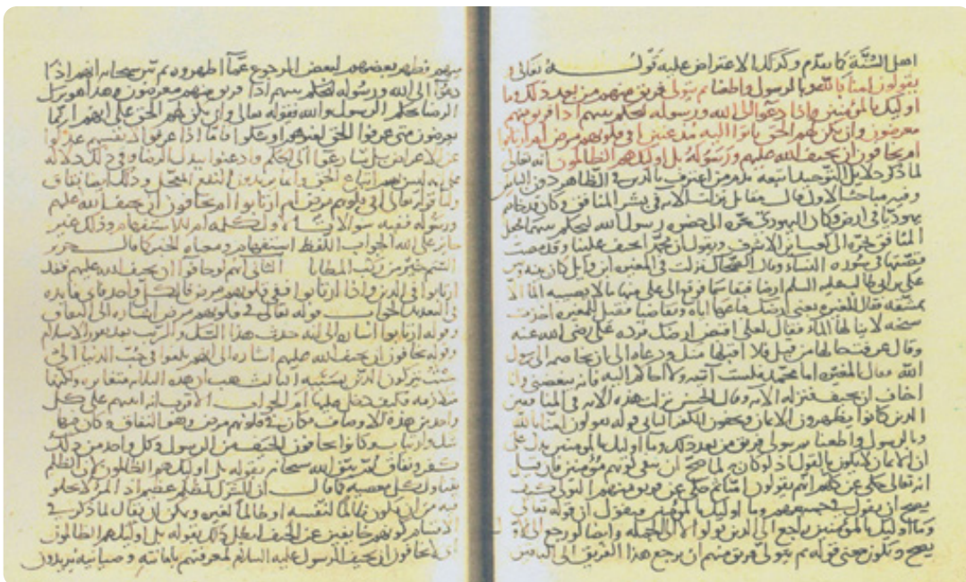
الصورة الأولى من النسخة (م) للجزء الخاص بهذا البحث.