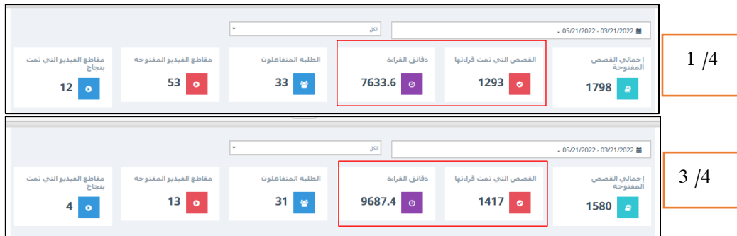
شكل (2): عدد الدقائق المستغرقة في القراءة وعدد القصص المقروءة خلال فترة التطبيق.

يتبين من الجدول 4 أن تقديرات التلاميذ وأمهاتهم لدور منصة نهلة وناهل في اكتساب العادات القرائية لديهم جاءت كبيرة. ومما يؤكد تأثير منصة نهلة وناهل على تكوين عادات قرائية ما كشفه ملخص التقرير الذي أظهر عدد الدقائق التي قضاه