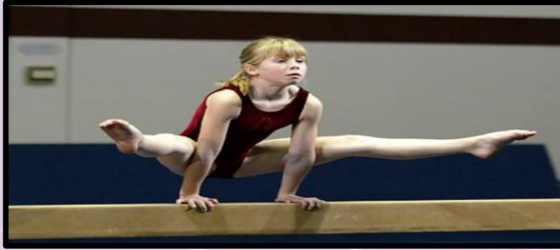
شكل (2) يبين مهارة القفز فتحا على الجهاز