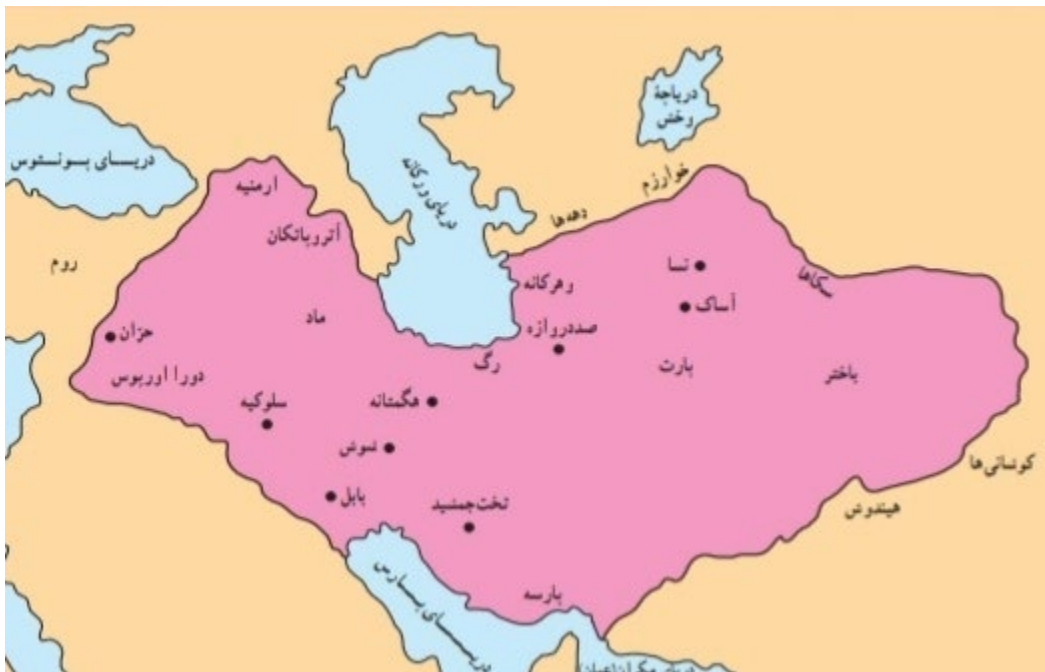
(قادری، 1390: 169) پاشکۆ، 1 سنووری جوگرافی دهوله تی نه شکانی