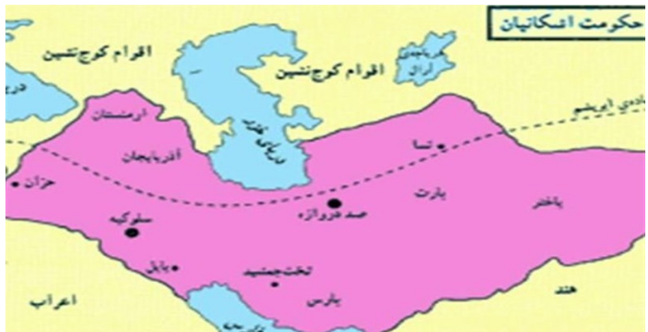
(قادری، 1390: 168) پاشکۆ، 2 پنگای ناوریشم