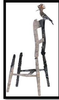
(شكل 6) (كرسي) 2011 مواد مختلفة مع طائر مهدد