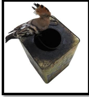
(شكل 7) سلام كاذب 2013 مواد مختلفة