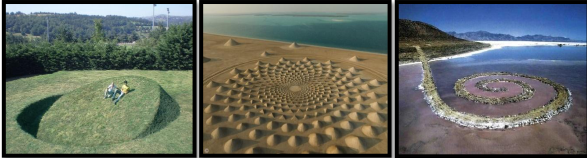
شكل 5 – نماذج من فن الأرض أو الأعمال الترابية

ومن الفنون التي لها علاقة مباشرة مع البيئة (فن الأرض أو الأعمال الترابية)*** (شكل5) ويعود إلى بداية السبعينات من القرن الماضي، ويعد شكل من أشكال الفنون المعاصرة، قرر فيه بعض الفنانين نقل أعمالهم من أروقة الفن الضيقة إلى أحضان الطبيعة الرحبة، في محاولة منهم للعودة إلى الطبيعة واختبارها مجدداً وفهمها وتأملها عن طريق انعكاس أعمالهم وتأثيرها على المتلقي، بالأخذ مواداً في أعمالهم من نفس المادة الطبيعية المحيطة بها. إذ " ينغمس الفنان مباشرة في ما هو محسوس ملموس حاضر في اللحظة الآنية، ومشتبكاً مع بيئة المكان وأحياناً يكتفي بإبنتاق فكرته الإبداعية في رأسه، ويترك مهمة تنفيذها لحشد من المساعدين أو العمال الكفاء" (ناجي موسى باسيلوس، 2018، ص198)