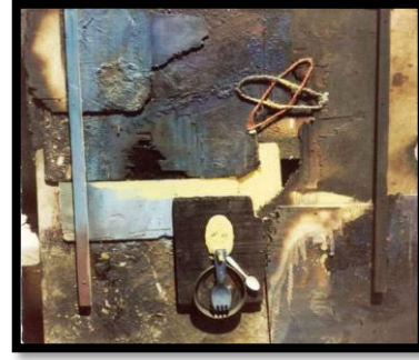
شكل (9) - وسائط متعددة على خشب - 1985 80 × شكل (10) (شجرة الذكريات) - مجسم، نيكيل مع مواد مختلفة، قطر 165سم - 2010