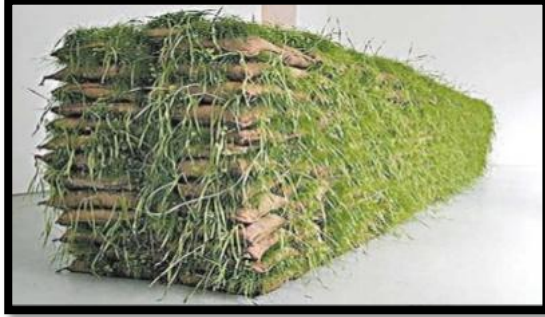
شكل 4- منى حاطوم – حديقة معلقة

كما ويلعب (الفن المفاهيمي)** دوراً مهماً في التأثير على البيئة عن طريق عدة طرق من بينها التوعية البيئية حول قضايا مثل التلوث وفقدان التنوع البيولوجي وتغير المناخ، عن طريق تقديم مفاهيم مبتكرة ورمزية، يمكن للفنانين إيصال رسائل قوية حول التحديات البيئية التي تواجهها الأرض، كما هو في عمل الفنانة الفلسطينية (منى حاطوم) (شكل4) "لمجموعة من الأكياس الترابية، وقد نمت عليها الأعشاب، وساهمت الطبيعة في هذا العمل، فالنباتات نابضة بالحياة مستمرة بالنمو وليست صناعية" (Jassim, 2015, p. 52).