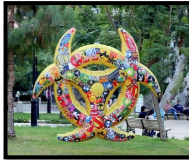
(شكل 8) خطر حيوي -2016 - بالون بلاستيكي قطر 300 سم

وتختلف غرائبية أفكارها وأساليبها بإبتكار تجربة جديدة مختلفة عن التجارب التقنية الموجودة في أعمالها الأخرى ؛ وذلك في عملها (بالون خطر حيوي)، وهو عبارة عن بالون مصنوع من البلاستيك الصناعي منفوخ بالهواء يطير فوق الأرض عرضته الفنانة في حديقة Sanayeh في بيروت - لبنان، وهو يحمل شكل رمز دولي يدل على وجود مواد سامة ضارة بالكائنات الحية، ويشير غلافها المطبوع بشعارات الشركات المختلفة إلى العلاقة بينهم وبين الاستهلاك وانتاج النفايات، وعرضته ببيروت إشارة لأزمة بيروت عام 2016 في مجال البيئة والصحة العامة، ويهدف هذا البالون إلى التحليق فوق المساحات الخضراء، كتحذير صامت عن تلوث البيئة، والذي يتم تجاهله من قبل الحكومات (شكل 8).