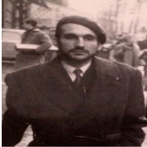
الفنان شاكر حسن ال سعيد