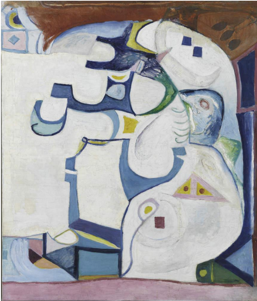
احد لوحات الفنان شاكر عام ١٩٥٩ ألوان زيتية على قماش، ٧٩،٣ × ٩٩،٧ سم متحف: المتحف العربي للفن الحديث، الدوحة

زار ال سعيد العديد من الدول منها سوريا ولبنان وفرنسا وانجلترا وبلجيكا ومدينة ميونيخ الالمانية والمملكة العربية السعودية والكويت وليبيا ونابولي وجنوا في ايطاليا و اشار ان الجهات التي اقتنت أعماله هي المتحف الوطني للفن الحديث، والقيادة القومية ومجموعات شخصية موزعة على هواة الرسم والفنانين الأصدقاء والمجموعة الخاصة ولوحات موزعة لدى بعض الاقارب (18) .