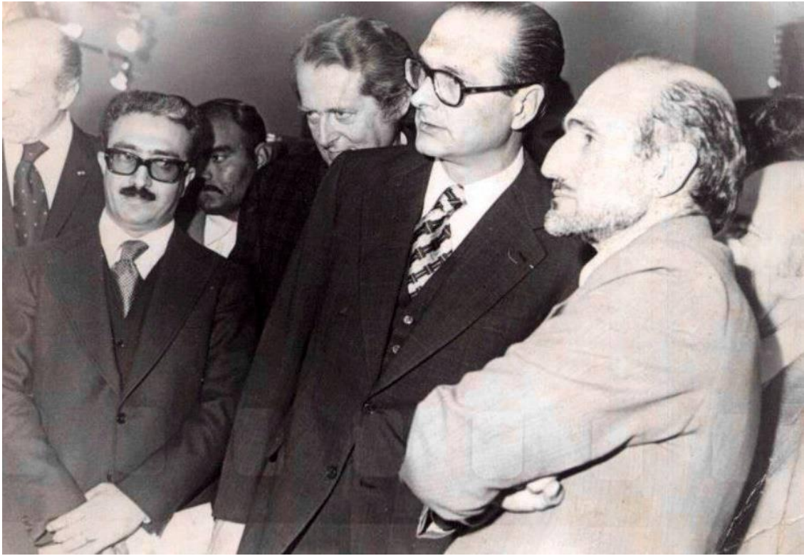
يميناً: شاكِر حسن آل سعيد، مع الرئيس الفرنسي السابق جاك شيراك ووزير الثقافة العراقي السابق طارق عزيز ١٩٧٠.