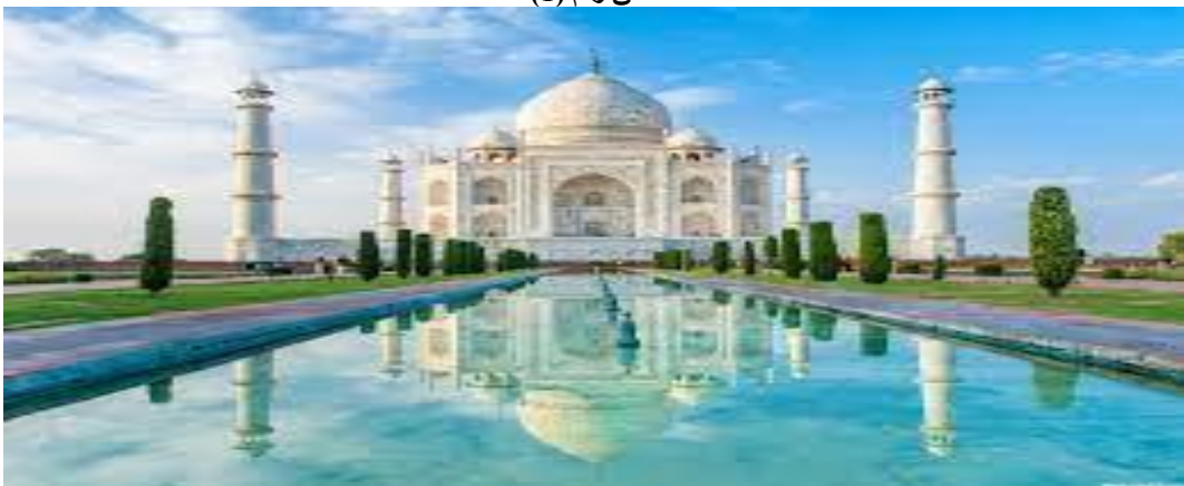
تاج محل من الخارج