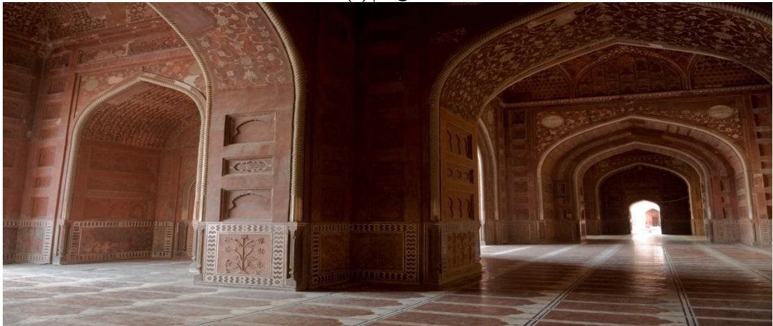
تاج محل من الداخل

https://www.google.com/search?q=%D8%AA%D8%A7