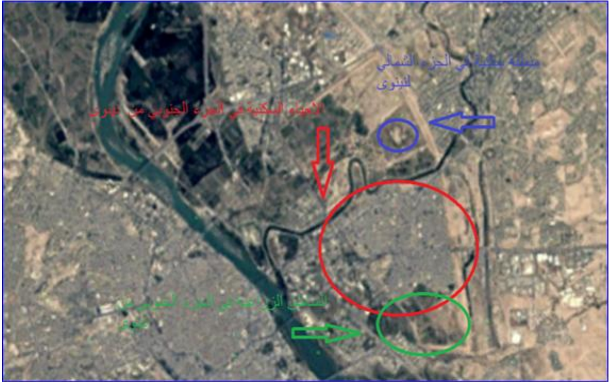
شكل ٣. ملتقطه بالأقمار الصناعية وتبين فيها مقدار الزحف الاستيطاني والزراعي للجزئين الجنوبي والشمالي من المدينة.

في المقابل، أظهرت النتائج أن الجزء الشمالي من المدينة ظل أكثر محافظة نسبياً خلال هذه المرحلة، حيث لم تتجاوز المساحات المستغلة للاستيطان (٠.٠٧ كم 2 )، وهي نسبة ضئيلة مقارنة بما حدث في الجزء الجنوبي. كما بلغت نسبة الأراضي الزراعية في هذا الجزء حوالي (٣٥%) من مساحته الكلية، مما يشير إلى استمرار الطابع شبه الريفي والاستخدام المحدود للأراضي، (شكل ٣).