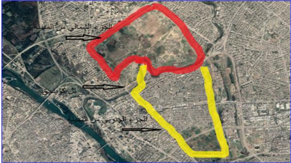
شكل ٦. يبين تقسيمات مدينة نينوى الأثرية

المناقشة: (Discussion): تكشف نتائج هذه الدراسة عن تحولات مكانية وزمنية عميقة في أنماط