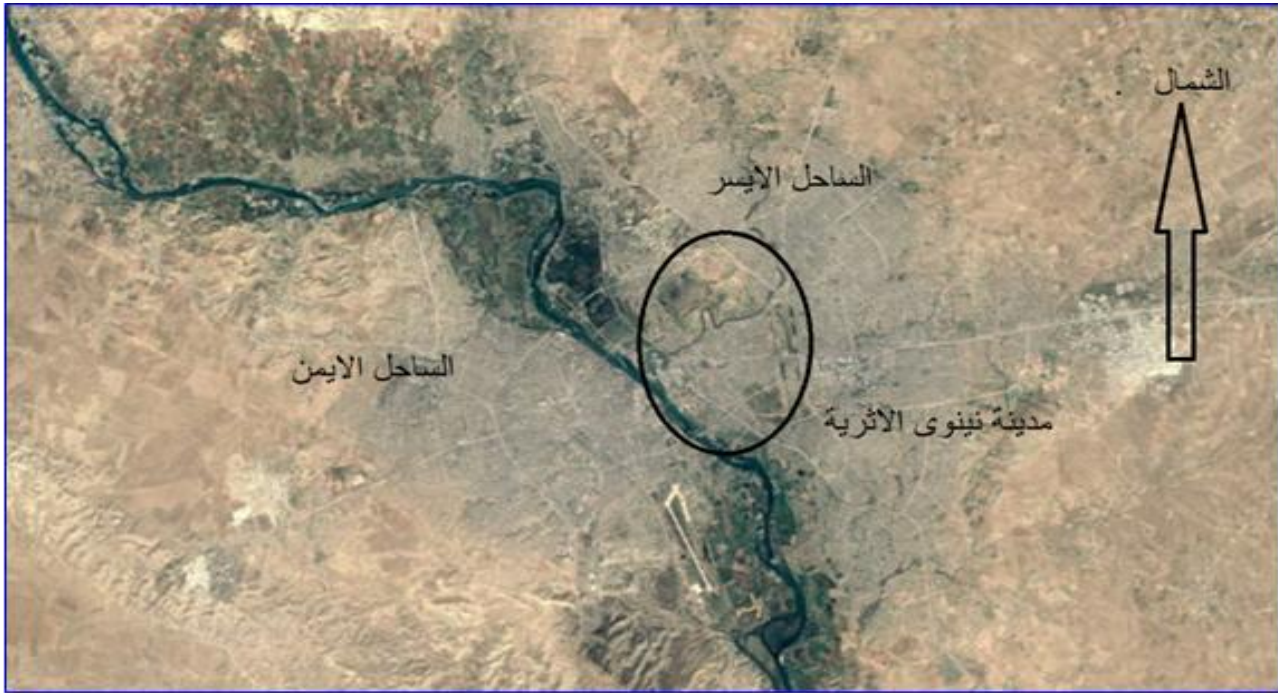
شكل (١) يبين مدينة الموصل وموقع مدينة نينوى الأثرية.

الدراسات السابقة (Literature Review): حظيت مدينة نينوى باهتمام واسع في الأدبيات العلمية، حيث تناولتها العديد من الدراسات من زوايا أثرية وتاريخية وجغرافية، فضلاً عن الدراسات الحديثة التي ركزت على التغيرات في استخدامات الأراضي والتوسع العمراني وتأثيره على المواقع التراثية. أولاً: الدراسات الأثرية والتاريخية: تُعد الدراسات الأثرية المبكرة الأساس في فهم الأهمية الحضارية لمدينة نينوى، إذ قام (Layard, 1853) بأولى الاكتشافات العلمية التي كشفت عن معالم المدينة، بما في ذلك القصور الملكية والنقوش الآشورية، مما أسهم في إبراز مكانتها كعاصمة للإمبراطورية الآشورية. كما أشار (Curtis & Reade, 1995) إلى القيمة الفنية والحضارية للآثار الآشورية المكتشفة، مؤكداً على الدور الثقافي والسياسي لنينوى في تاريخ المنطقة. وفي السياق ذاته، قدم (Hansen, 2001) تحليلاً شاملاً للأبعاد الجغرافية والأثرية للمدينة، موضحاً ارتباطها بالبيئة الطبيعية ونظم الري القديمة، في حين ركز (Reade, 2000) على الجوانب الثقافية والمعرفية، خاصة دور مكتبة آشوربانيبال في تطور المعرفة الإنسانية. ثانياً: الدراسات المتعلقة باستخدامات الأراضي والتوسع العمراني: شهدت الدراسات الحديثة اهتماماً متزايداً بتحليل التغيرات في استخدامات الأراضي، حيث أوضح (Lambin et al., 2003) أن التحولات في استخدام الأرض ترتبط بشكل مباشر بالنمو السكاني والضغط الاقتصادي، مما يؤدي إلى استهلاك الأراضي ذات القيمة البيئية أو التراثية.