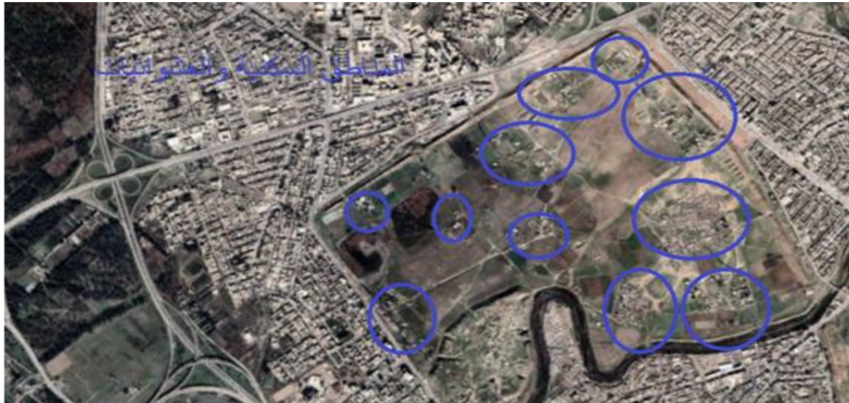
شكل ٥. الوضع الحالي للجزء الشمالي من المدينة الاثرية.

وبناءً على ذلك، يمكن توصيف هذه المرحلة بأنها مرحلة الخطر الحرج (Critical Risk Phase) ، حيث تتعرض بقايا المدينة الأثرية، وخاصة في الجزء الشمالي، إلى تهديد مباشر قد يؤدي إلى فقدانها بشكل شبه كامل في حال استمرار التوسع العمراني والتجاوزات دون تدخلات تنظيمية فعّالة (شكل ٦).