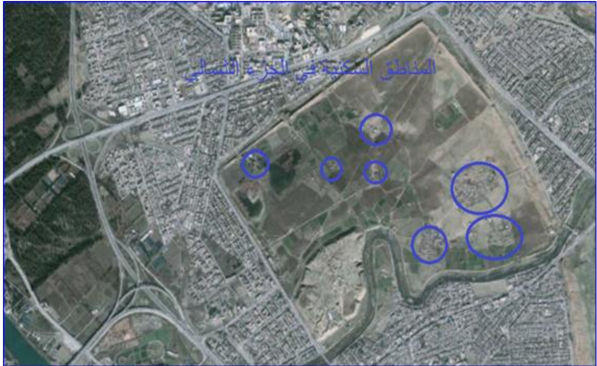
شكل ٤. صورة فضائية ملتقطة بالاقمار الصناعية لسنة ٢٠١١ مبيّنا عليها الجزء الشمالي للمدينة الأثرية حيث ازدياد الزحف الاستيطاني.

وعليه، يمكن توصيف هذه المرحلة بأنها مرحلة التسارع في الزحف الاستيطاني ( Accelerated Encroachment Phase )، حيث انتقل الضغط العمراني من الجزء الجنوبي المشبع إلى الجزء الشمالي، مما أدى إلى تهديد مباشر للمناطق الأثرية التي كانت حتى وقت قريب أقل تأثراً.