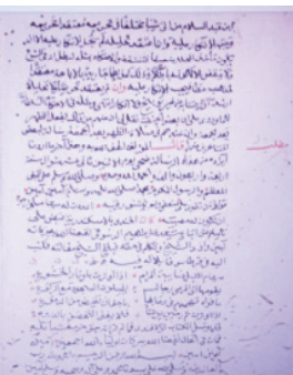
نهاية نسخة (ب)