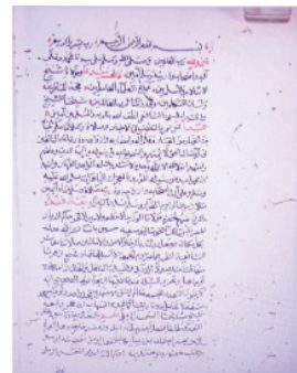
بداية نسخة (ب)