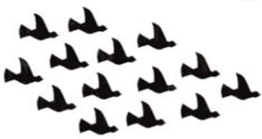
الشكل (١) الحركة العشوائية للطيور

وهي مستلهمة من السلوك الاجتماعي للكائنات الحية مثل الأسماك والطيور والزواحف وغيرها من الكائنات الحية. هنا يأتي تحسين سرب الجسيمات (PSO) من سلوك البحث عن الطعام المستوحى من الطبيعة من قبل الأسماك والطيور للحصول على أفضل طريقة لتحقيق الهدف، إذ تعتبر الأسماك والطيور بمثابة الجسيمات في الخوارزمية (Yin,2023:3). يعمل كل جسيم كوكيل مستقل في هذه الخوارزمية يستكشف مساحة المشكلة بناءً على خبراته الخاصة وتفاعلاته مع الجسيمات الأخرى (Ab.Aziz,et.al,2023:5). كما يمثل حجم السرب عدد المشاهدات المستخدمة في البحث، حيث يشير إلى عدد الحلول التي يتم تحليلها في كل تكرار (Koçak&Örkçü,2024:882). ويمكن توضيح التفسير البصري لخوارزمية (POS) من خلال الشكل الاتي :