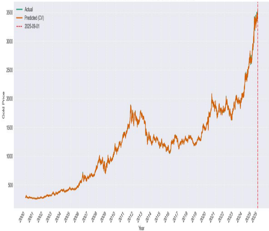
Gold Prices: Actual vs Predicted (Up to 2025-09-01)

شكل (٥) الاتجاه العام لاسعار الذهب لاسعار الحقيقية والاسعار المتنبأ بها للمدة (٢٠٠٠/١/١ - ٢٠٢٥/٨/٣١)