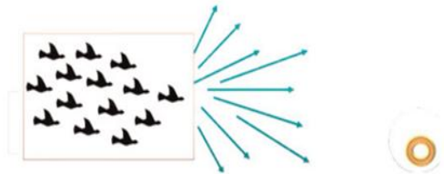
الشكل (٢) الطيور تتحرك نحو الطعام